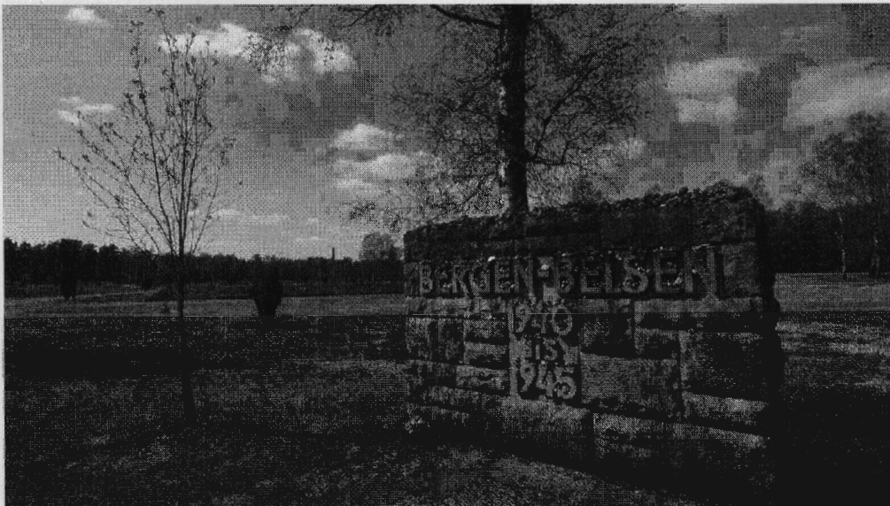
Die KZ-Gedenkstätte Bergen-Belsen